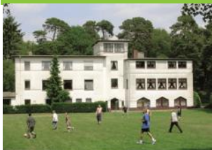
Ev. Gästehäuser Sandkrug

Oldenburger Weg 1 26209 Sandkrug Tel: 04481 909977 Fax: 04481 909970 info@eg-sandkrug.de www.eg-sandkrug.de