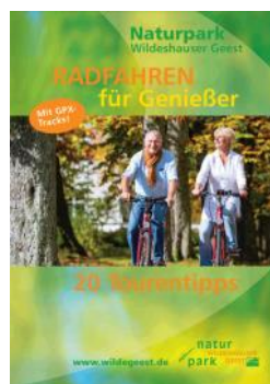
20 Tourentipps „Radfahren für Genießer“

Diese und viele weiteren Karten sowie Informationsmaterial erhalten Sie im Rathaus.