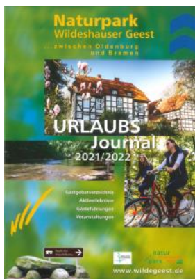
Urlaubsjournal Naturpark Wildeshäuser Geest