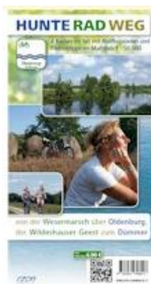
Radkartenset „Hunte-Radweg“, 6,90 €