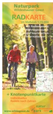
Radkarte „Naturpark Wildeshäuser Geest“, 5,90 €