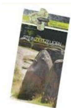
Informationen zur Straße der Megalithkultur